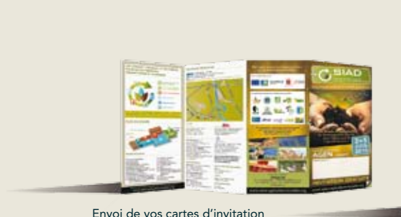
Envoi de vos cartes d'invitation